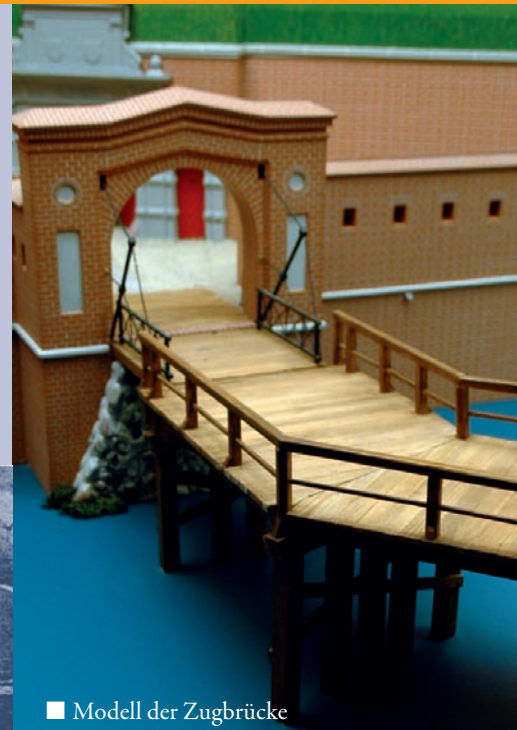
■ Modell der Zugbrücke