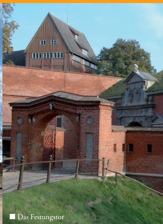
■ Das Festungstor