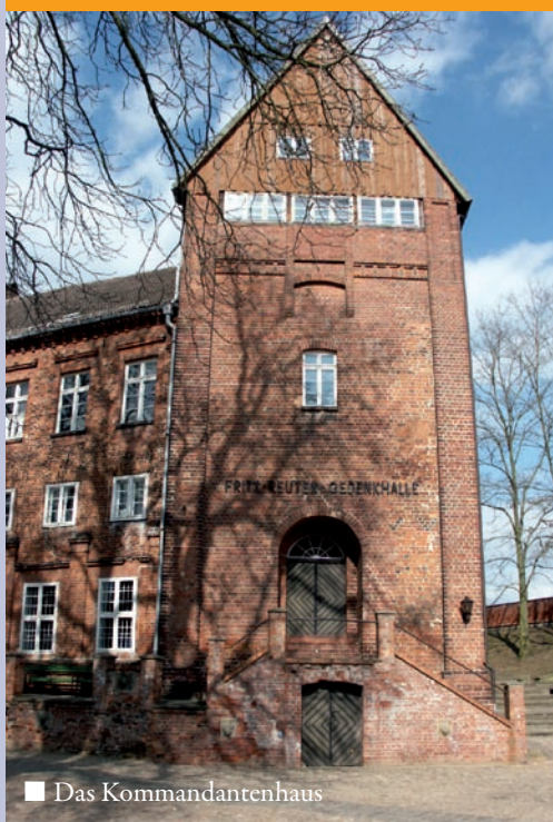
■ Das Kommandantenhaus

Spendenkonto: Förderkreis Festung Dömitz e.V., Konto Nr. 1530000650, Sparkasse Mecklenburg-Schwerin, BLZ 14052000