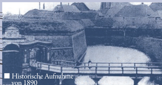
■ Historische Aufnahme von 1890

1902 wurde die Brücke daraufhin abgerissen und durch einen Damm ersetzt. Die Wiederaufbau der Festungsbrücke von 1865 wäre ein bauhistorisch besonders wichtiger Teil im Sanierungsvorhaben Festung Dömitz. Nach der Planungsphase, die noch in diesem Jahr beginnt, ist der Baustart für 2010 vorgesehen.