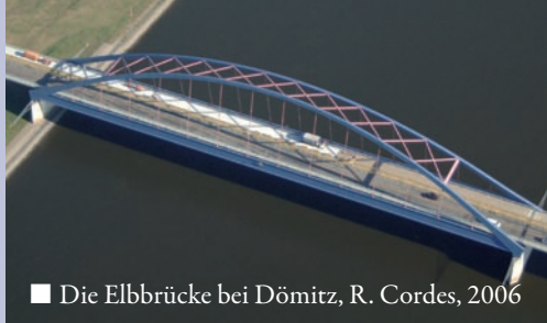
■ Die Elbbrücke bei Dömitz, R. Cordes, 2006

In Dömitz selbst, auch bekannt durch eine viel befahrene neue Elbbrücke, überzeugt die charmante Atmosphäre einer kleinen Stadt mit sehenswerten historischen Schätzen, von denen der bedeutendste die Renaissance-Festung ist. Die Festung Dömitz, auf den Resten der alten Burg Dömitz errichtet, ist eine der