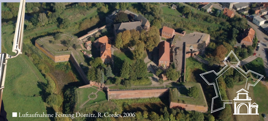
■ Luftaufnahme Festung Dömitz, R. Cordes, 2006