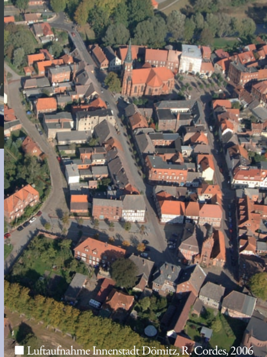
■ Luftaufnahme Innenstadt Dömitz, R. Cordes, 2006

Auf Grund der Besonderheit des Bauwerks und seines außerordentlich guten Erhaltungszustands wurde die Festung, die seit über 50 Jahren auch ein Museum beherbergt, 1975 unter Denkmalschutz gestellt. Vor einigen Jahren beschloss die Stadt die umfassende Sanierung der Gebäude und Anlagen, inklusive der historischen Zugbrücke.